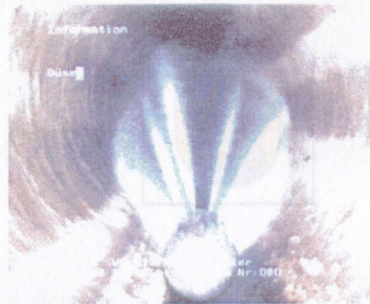
Kanalarreinigungsdüse im Einsatz

Zur Beseitigung der Ablagerungen gleitet eine Reinigungsdüse langsam vom Fahrzeug aus durch den zu reinigenden Kanal (Vorschub in Folge austretendem Hochdruckwasserstrahl). Beim anschließenden Zurückziehen der Düse wird das gelöste Material vor der Düse zum Fahrzeug hin transportiert. Dort wird es mit Hilfe eines Saugschlauches aufgenommen.