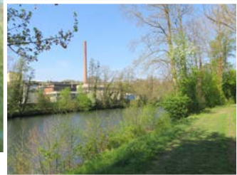
Perspektive mit Blick auf Häckerareal © PLANSTATT SENNER