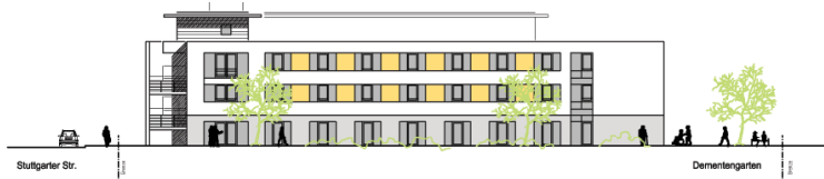
Ansicht West Pflegeheim