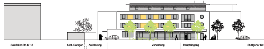
Ansicht Ost Pflegeheim