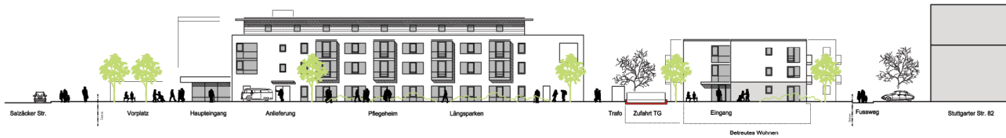
Ansicht Nord - Stuttgarter Straße