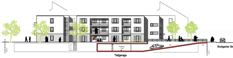
Ansicht Ost Betreutes Wohnen