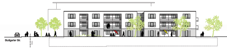
Ansicht West Betreutes Wohnen