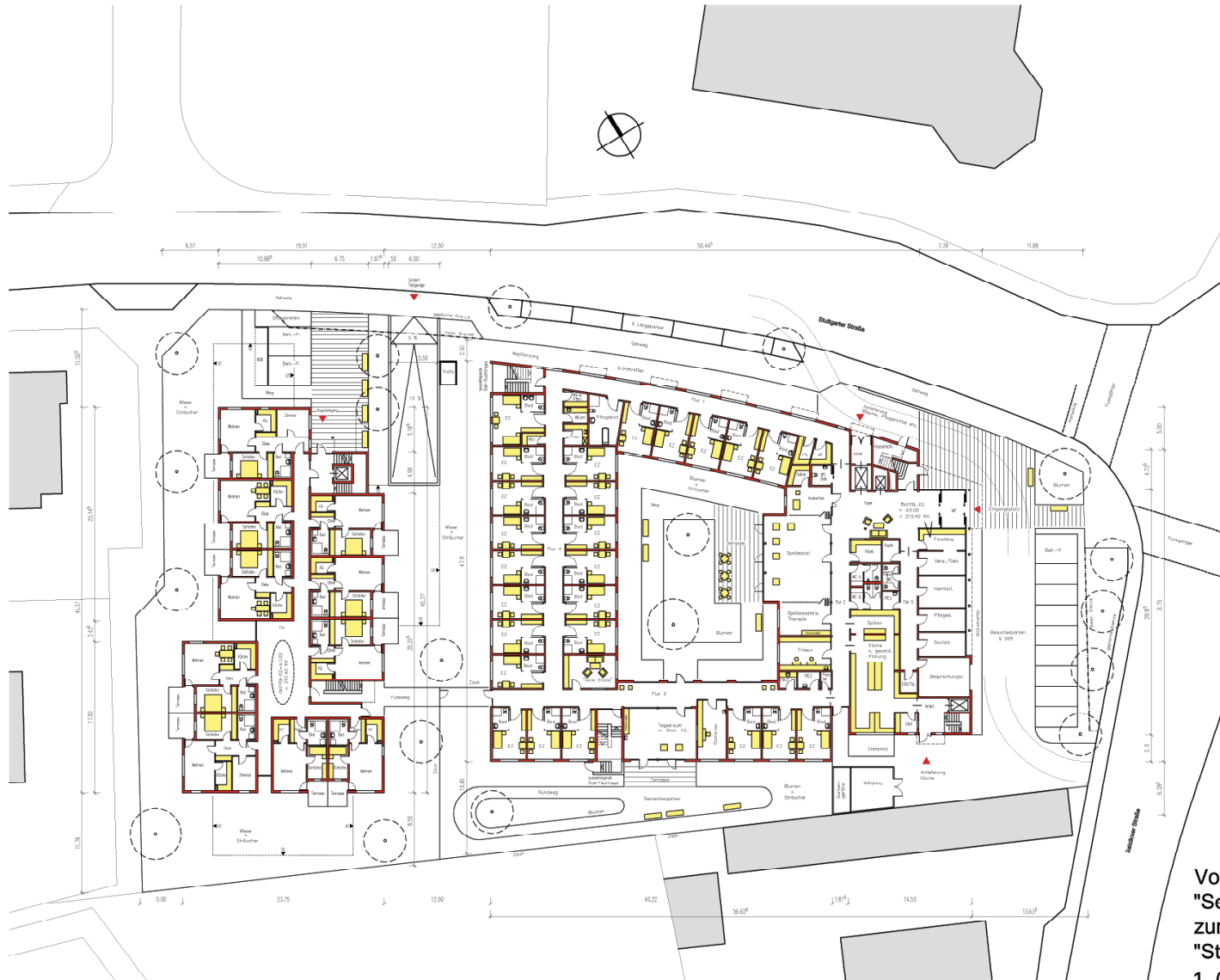
Vorhaben- u. Erschließungsplan "Seniorenzentrum Stuttgarter Straße" zum vorhabenbezogenen Bebauungsplan "Stuttgarter Straße/Austraße, 3. Teil, 1. (vorhabenbezogene) Änderung"