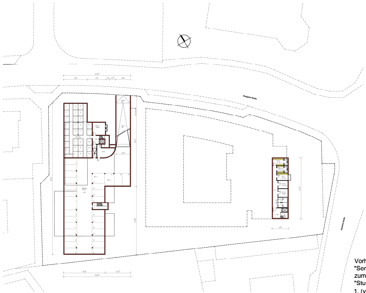
Vorhaben- u. Erschließungsplan "Seniorenzentrum Stuttgarter Straße" zum vorhabenbezogenen Bebauungsplan "Stuttgarter Straße/Austraße, 3. Teil, 1. (vorhabenbezogene) Änderung"