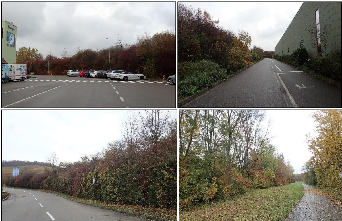
Abbildung 6: Gehölzbestände bzw. Heckenstrukturen im Randbereich der Ensinger Mineral-Heilquellen GmbH.

Innerhalb der vorhandenen Heckenstrukturen und Gehölzbestände mit einer gut entwickelten Unterholz- bzw. Strauchschicht ist zudem ein Vorkommen der Haselmaus ( Muscardinus avellanarius ) nicht auszuschließen.