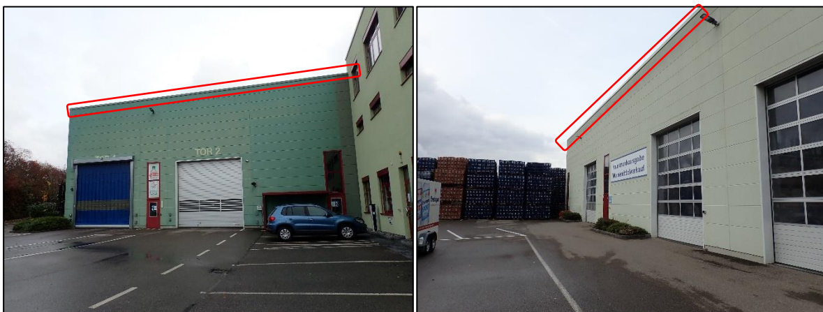
Abbildung 5: Attika (rote Markierung) am gesamten Dachbereich des Logistikgebäudes.

Die Metallverkleidung (Attika) am Dachbereich der gesamten Logistikhalle (vgl. Abbildung 5) eignet sich prinzipiell als Quartier für gebäudebewohnende Fledermäuse wie zum Beispiel die Zwergfledermaus. Allerdings dienen jene Quartiere ausschließlich als Sommerquartier, da keine Frostsicherheit gegeben ist. Hinweise (vgl. Tabelle 1) die auf eine Nutzung der Attika als Quartier hindeuten, wurden nicht festgestellt. Eine Nutzung dieser Struktur kann dennoch nicht ausgeschlossen werden.