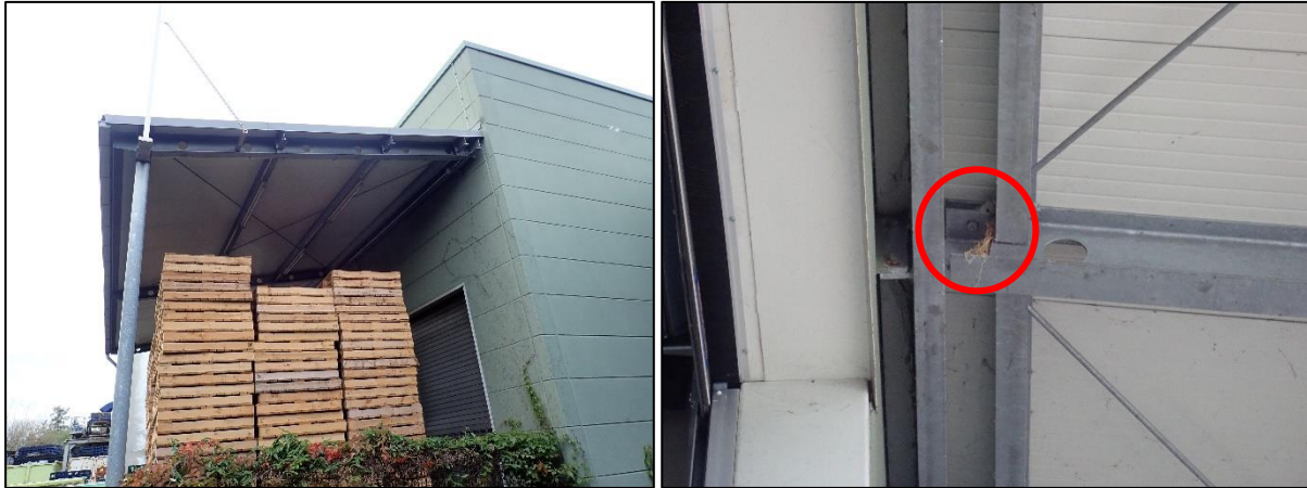
Abbildung 4: Überdachter Bereich südlich des Palettierzentrums (linkes Bild) und ehemaliges Nischenbrüternest an einem Metallbalken (rechtes Bild, rote Markierung).

Die Logistikhalle innerhalb des Untersuchungsgebiets bietet in geringem Umfang Strukturen, welche für gebäude- bzw. nischenbrütende Vogelarten und gebäudebewohnende Fledermäuse potenziell nutzbar sind. Für gebäude- bzw. nischenbrütende Vogelarten eignen sich die Metallbalken der Überdachung auf der südlichen Seite des Palettierzentrums. Die ehemalige Nutzung konnte durch ein Nest (vermutlich Hausrotschwanz) nachgewiesen werden (vgl. Abbildung 4).