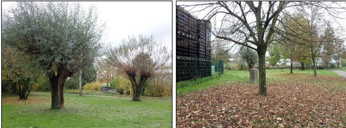
Abbildung 9: Freistehende Gehölze im westlichen Teil des Untersuchungsgebiets.