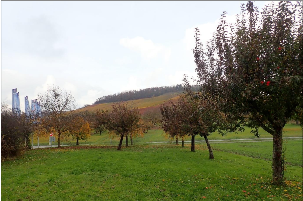
Abbildung 7: Streuobstwiese im Osten des Untersuchungsgebiets.