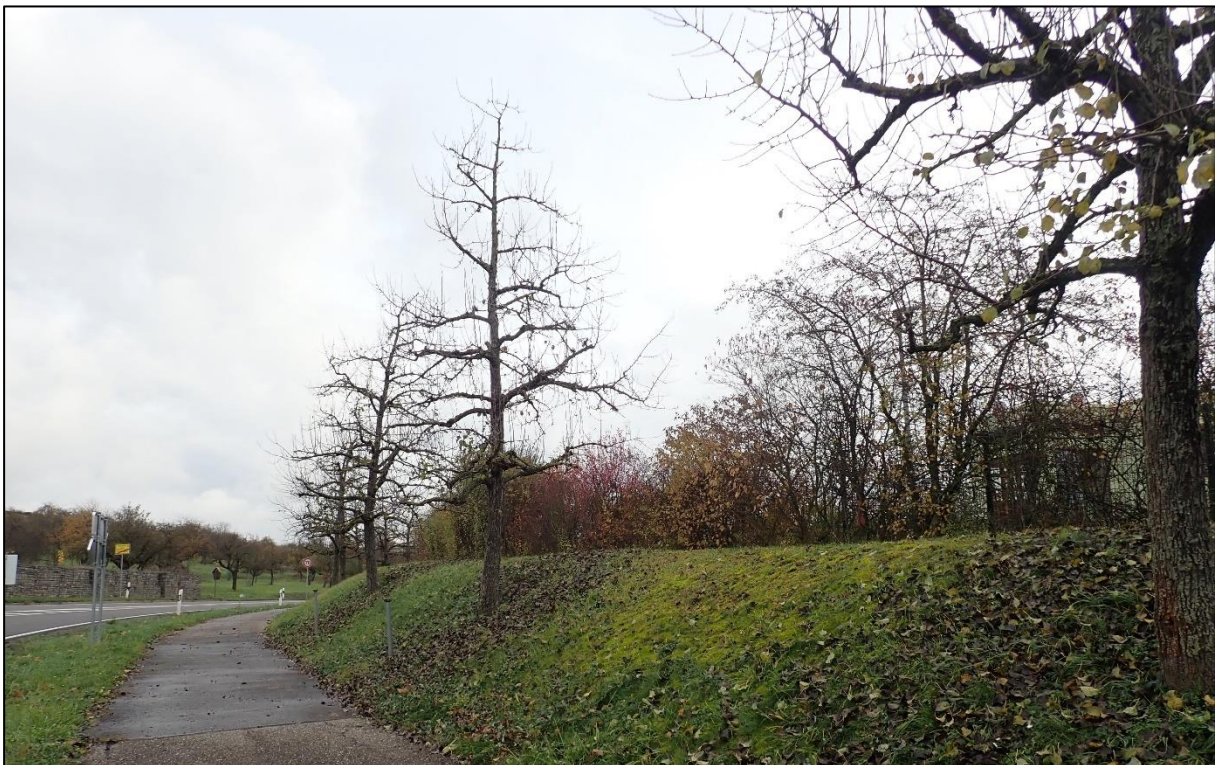
Abbildung 8: Obstbaumreihe entlang des Radwegs im Norden des Untersuchungsgebiets.