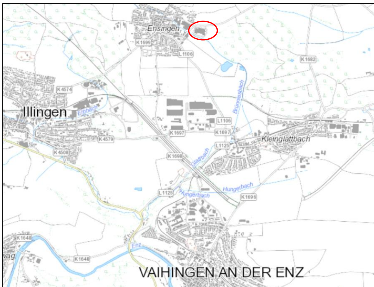
Abbildung 1: Lage des Vorhabensbereichs östlich von Vaihingen-Ensingen (rote Ellipse).

Das Untersuchungsgebiet des Bauvorhabens „Ensinger – Erweiterung Logistik“ befindet sich am östlichen Siedlungsrand von Ensingen, einem nördlich gelegenen Stadtteil der Großen Kreisstadt Vaihingen an der Enz im Landkreis Ludwigsburg (vgl. Abbildung 1).