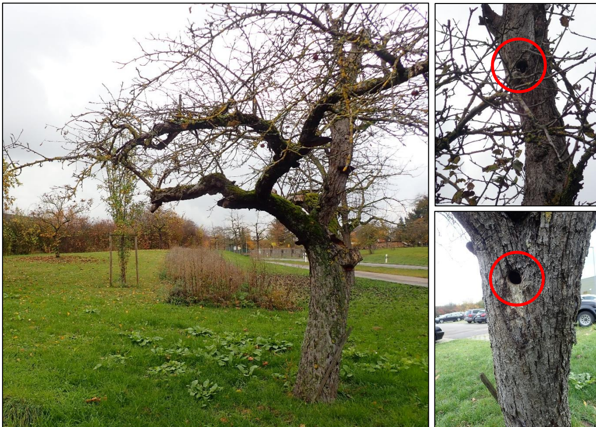
Abbildung 10: Habitatbaum mit zwei Spechthöhlen (roter Kreis) auf der Grünfläche, westlich des Pkw-Parkplatzes.