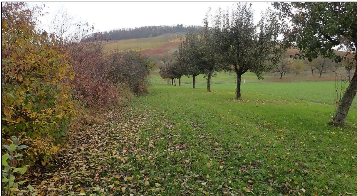
Abbildung 11: potenzieller Reptilienlebensraum entlang der Übergangsbereiche zwischen hoher und niedriger Vegetation.

Der südlich des Vorhabensbereichs verlaufende Brünnelesbach führt nur sehr wenig Wasser und stellt somit für Amphibienarten des Anhangs IV der FFH-Richtlinie kein geeignetes Laichgewässer dar. Südöstlich des Untersuchungsgebiets, in etwa 600 m Entfernung befindet sich das geschützte Naturdenkmal „Feuchtgebiet im Gewann Koessler“ sowie der Ensinger See. Eine Nutzung dieser Biotope als Amphibien-Laichgewässer ist anzunehmen, ebenso wie die Nutzung umliegender Flächen (Waldgebiet) als Landlebensraum. Aufgrund der Entfernung zwischen dem Vorhabensbereich und den potenziellen Laichgewässern, ist eine Nutzung des Vorhabensbereichs als Landlebensraum allerdings sehr unwahrscheinlich.