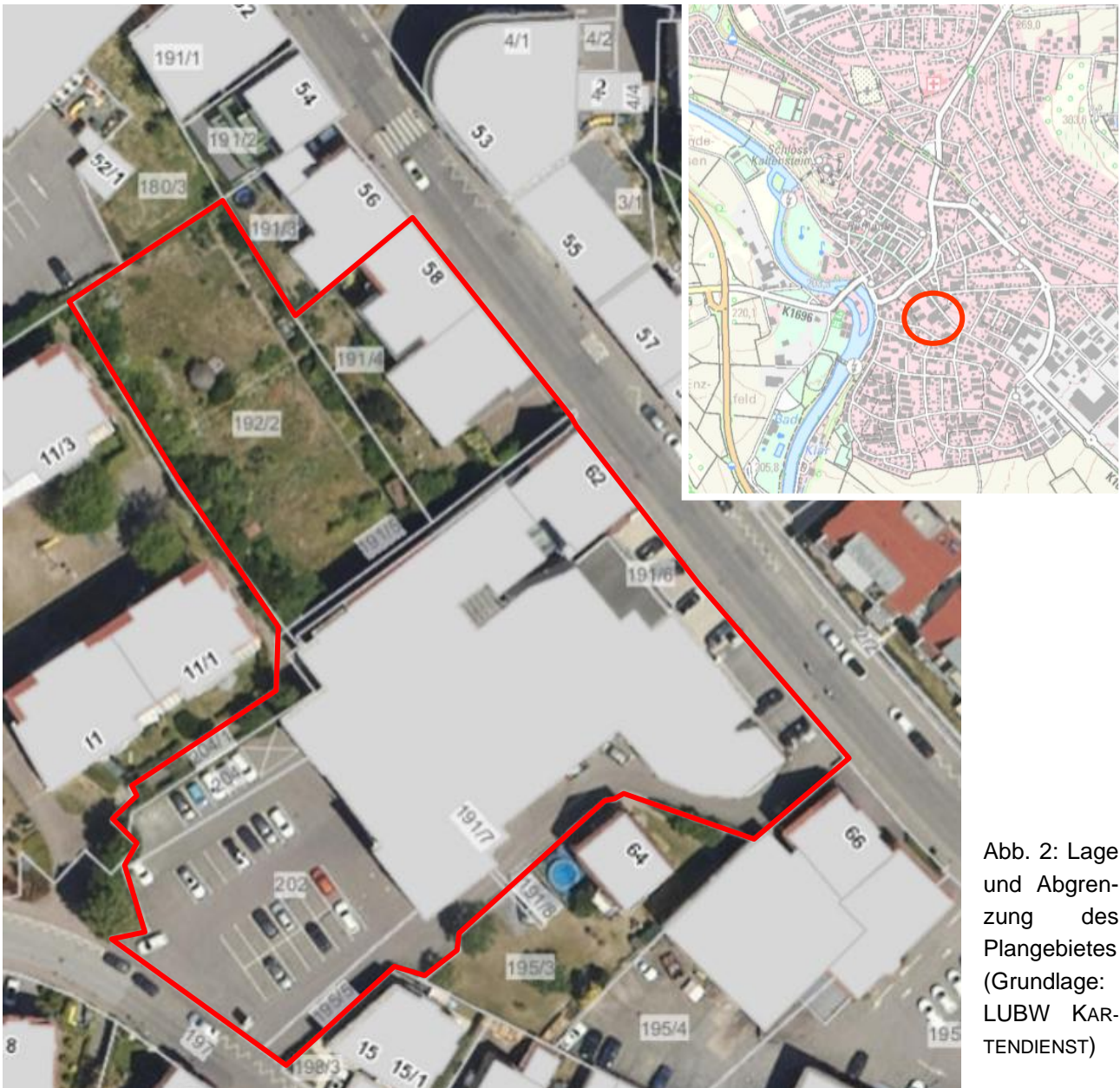
Abb. 2: Lage und Abgrenzung des Plangebietes (Grundlage: LUBW KARTENDIENST)

Der rückwärtige Garten geht in das anschließende Gartengrundstück über. Die ehemaligen Gärten sind aufgelassen und werden von Ruderalvegetation eingenommen, wobei aktuell kein Gehölzbestand zu finden ist. Zudem sind drei alte Gartenhäuschen vorhanden. Der Hang wird teilweise von Trockensteinmauern abgefangen (vgl. Abb. 5).