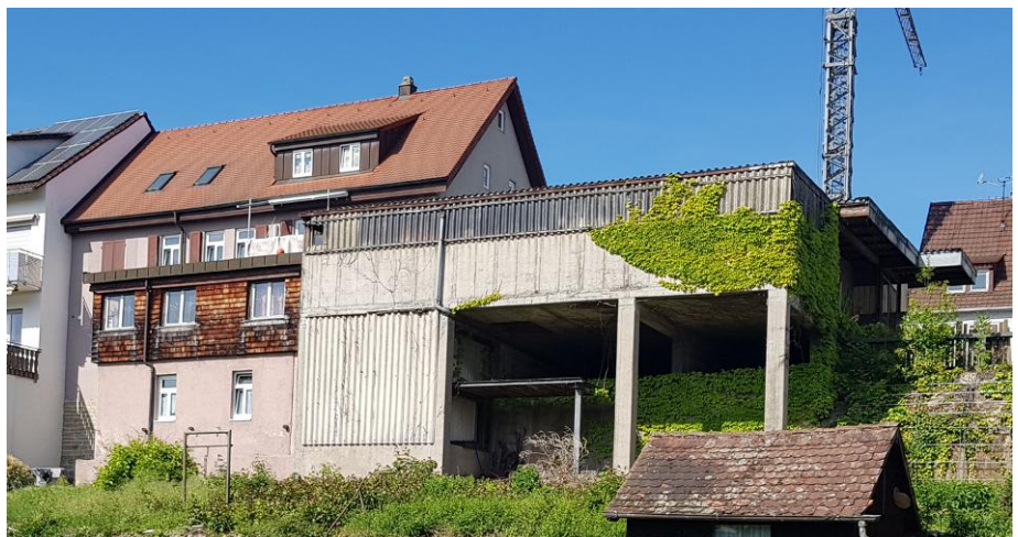
Abb. 4: Gebäudebestand Stuttgarter Straße 58