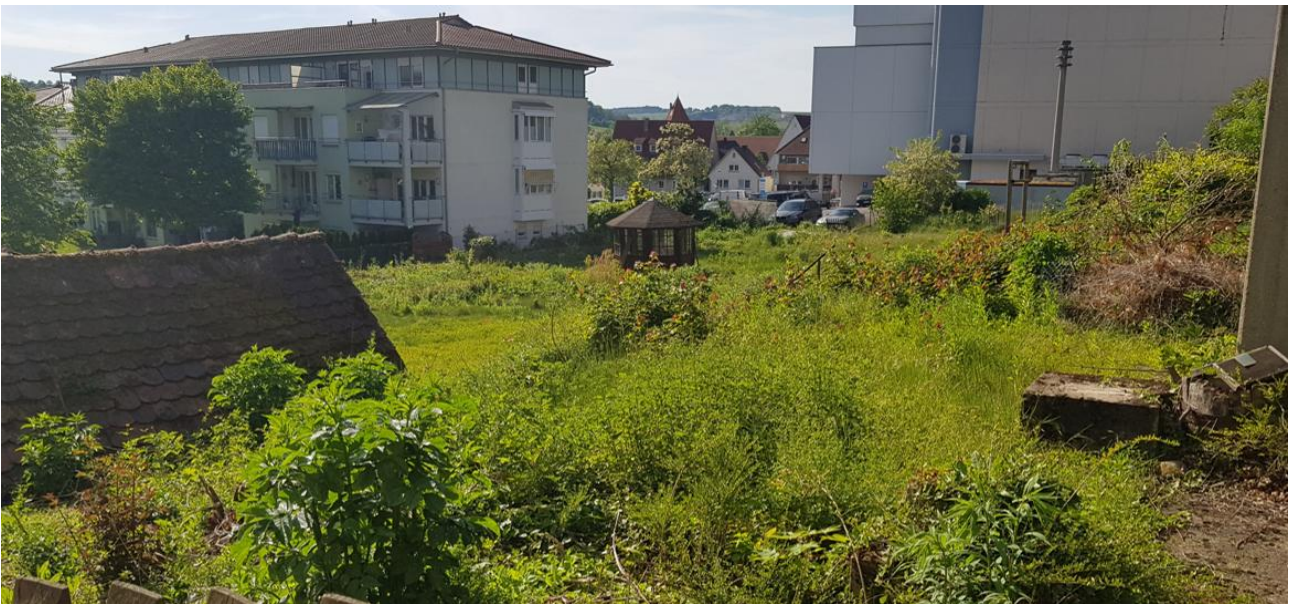
Abb. 5: Rückwärtige Gärten