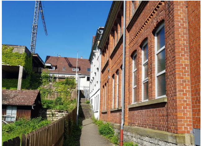
Abb. 3: Grundstück Stuttgarter Straße 62